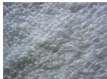
【パイル生地の表面】