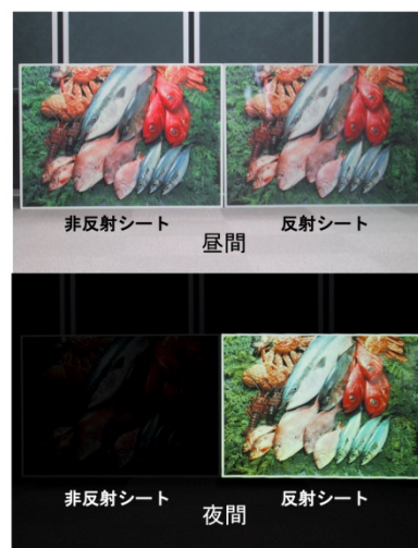
【昼間と夜間の反射シートの効果】