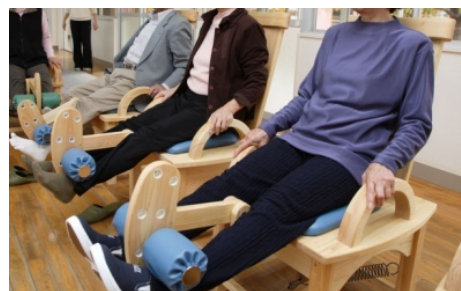
【 トレーニングの様子 】