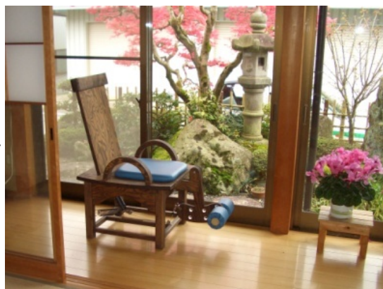
【 和室でトレーニング 】

・和歌山大学教育学部体育学教授や和歌山県工業技術センターと研究・開発を進め、地元の製造会社複数に委託する予定。