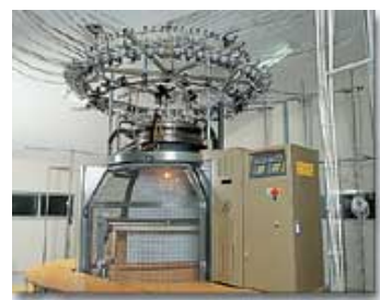
【シンカーベロア生産設備】