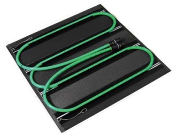
【本事業製品 (樹脂管を使用)】