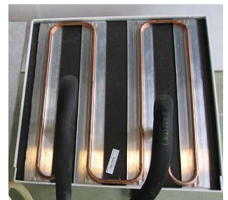
【欧州のパネル(金属配管)】