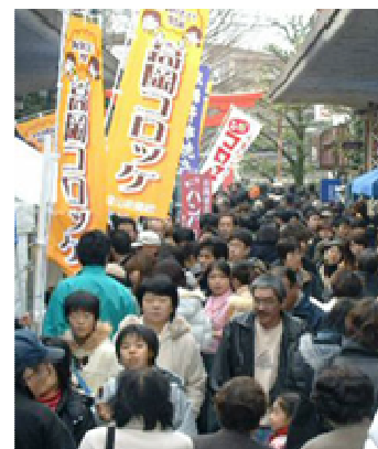
【コロッケイベント】