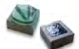
【金属棒にガラスを流し込む「ガラスキャスト」】