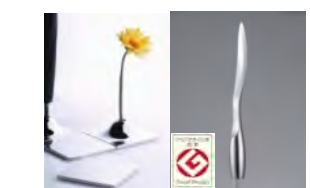
【高耐蝕性アルミに機能性を持たせた「AQUARIUM」】