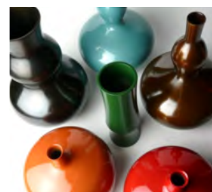
【ユーザーセレクションデザイン花器「Asiwai」】