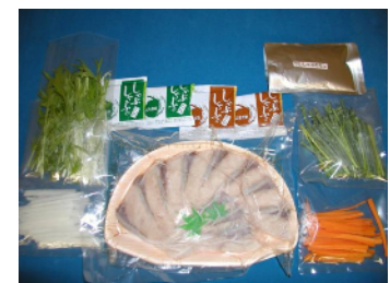
【ぶりしゃぶセット】