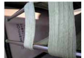
【ナノプラチナセラミックスを用いた染色比較試験】