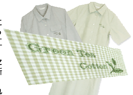
【従来緑茶染繊維製品例】

(株)エルブは、緑茶を中心とした天然物の効能効果を工業製品に応用して、緑茶染や家電部品などアウトソーシングで物作りを行っている会社であるが、そのルーツは緑茶染の工業化であり、染色工場とコラボして浜松で製造を行ってきた。今回それに加え、当社が開発した新しい技術であるナノプラチナセラミックスを応用し、遠州織物という地域資源を活用して、全く新しい還元緑茶成分を応用した緑茶染繊維製品の開発を行う。商品群は綿生地であり、シャツ、パジャマ、肌着など肌に直接触れる還元度の高い新鮮な商品を中心とする。