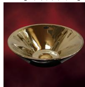
【メタリックタイル】