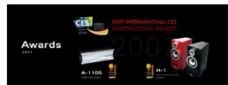
【インターナショナルCES・イノベーションアワード受賞製品】