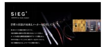
【車室内音響特性測定器】