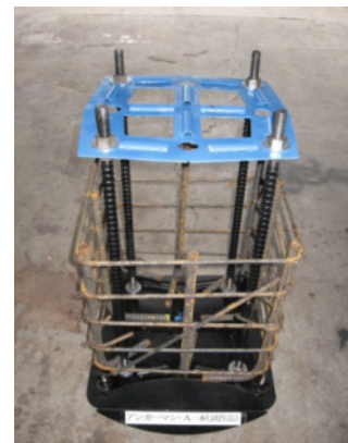
【試作品（鉄筋配筋後）】

・日本は地震大国であるため、当社は様々な高耐久で高耐震性能を有する商品開発に取り組んできた。 ・本事業では、地域資源である鉄製や鋳物製の建築金物への加工技術を活用し、鉄骨造りに使われる基礎アンカーフレームとして、工具を使わずに簡単に施工でき、多機能締結金物を使用することにより、据付位置の正確性と水平レベル出し機能を備えた「鉄骨造用・基礎アンカーフレーム『アンカーマン』」を開発し製造販売する。