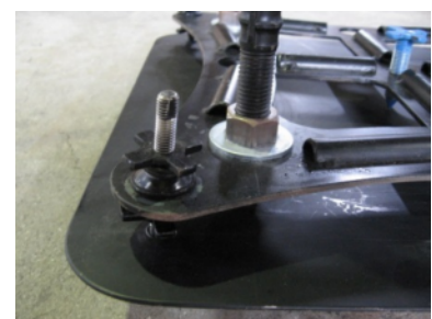
【多機能締結金物（締結後）】

・業界新聞やホームページを活用した販売チャンネルを構築し、一般建設施工会社向けのサービス販売を实践するなどにより、建築施工企業を獲得する。