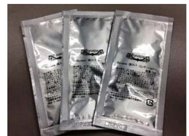
【仕上がりサンプル】