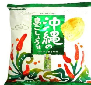
[山芳製菓 期間限定]