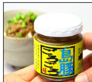
[島豚ごろごろピパーツ カレー味(仮称)]