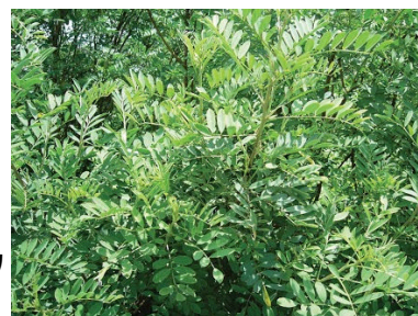
[ ナンバンコマツナギ ]

また、重点販路の開拓を目的としたマーケティング及びネットワークの構築を段階的に取組み、売上げの向上を目指す。