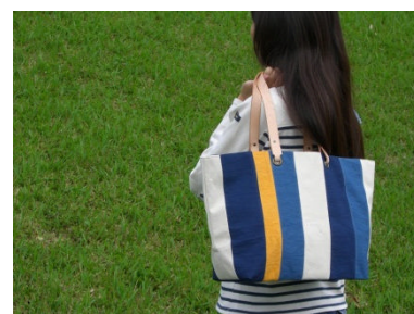
[ 自社ブランド「shimaai」 ]

・自社内での原料供給の状況を見据え、地域内農家との連携や、織物組合など染織業界内への原料の供給、技術提供等を行う。