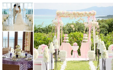
[クラブメッド・チャペル・ウェディング]