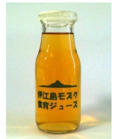
給食用ジュース (イメージ)