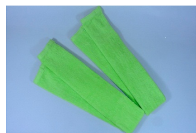
【上半身用トレーニングツール】

トレーニングプログラムの効果の確認を美作大学や岡山大学等の協力により実施しており、商品の開発・改良にあたり、今後も指導・助言を受ける予定である。