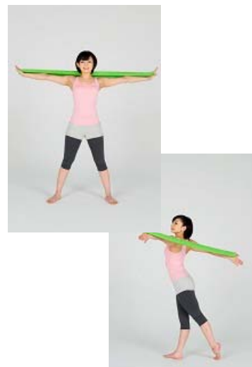
【トレーニングツールを使用した運動】