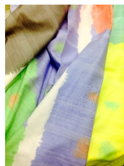
地域産業資源 見附織物製品

地域産業資源である「見附織物製品」の産地技術である中番手から太番手の節のある綿糸を使用して、複合系の組み合わせによる「多重織り」技術と、「インクジェット解し織り」技術を活用して、耐久性が高く丈夫な本物感のある柄表現を実現した、服飾雑貨(ストールとバッグ)を開発する。