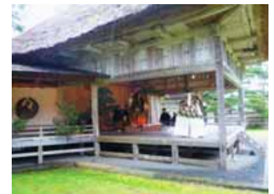
佐渡に残る能舞台