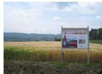
二条大麦畑(宮崎県高原町)

「地ビールブーム」を背景に東京、大阪など都心部において続々と乱立している地ビール専門のビアバーを中心として、飲食店、大手百貨店、小売店などで販路を開拓する。また、通販会社、自社オンラインショッピングなどネット取引やOEM、PBなどの取引交渉も行き、新分野での販路開拓も行う。