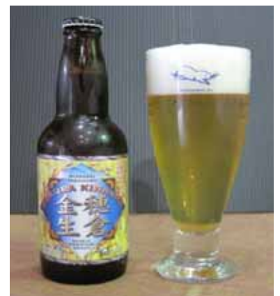
SPG膜ろ過ビール(穂倉金生)

県内農業法人、JAなどから原料を仕入れ、宮崎県食品開発センターなど公設試験場、民間企業などから技術支援を受ける。開発資金は宮崎県を中心に支援を受ける。