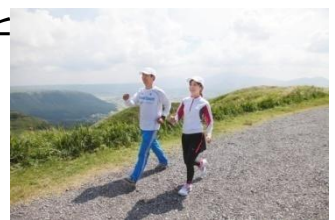
【トレッキング風景】

一般的なカロリーダイエット法では、食事制限(カロリー制限)を主とするため、継続性やダイエット後のリバウンド等に課題があるのに対して、本ダイエットプログラムは、糖質をコントロールして、美味しいものを食べながら健康的に痩せる方法である。また阿蘇ならではの標高差を活用した運動プログラムや温泉保養も盛り込んだ“全国初”の、効率的で持続性の高い『楽しく痩せて、美味しく痩せる』ダイエットプログラムである。