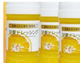
【甘夏ドレッシング】