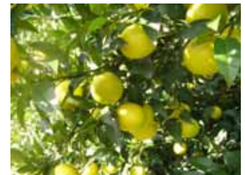
【県の新種みかん「湘南ゴールド」】