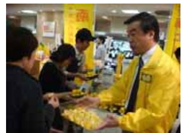
【今年行った松沢県知事による湘南ゴールドの試食PRの様子】 ビールの試飲PRも同時開催