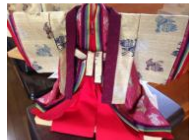
【伝統製法の丁寧な仕立て】

・自社直営店舗の他に、嗜好・価値観を共有できる県内外の取引先との協力連携により、新たな販促拠点として提携し、販路開拓を目指す。