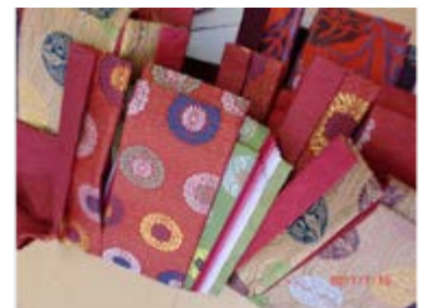
【多彩なパターンの裂地】