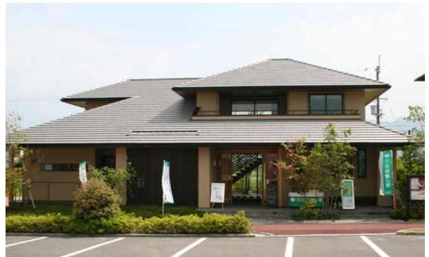
ユニット瓦の施工イメージ