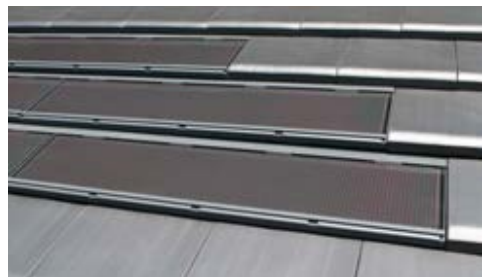
太陽光パネル一体型施工