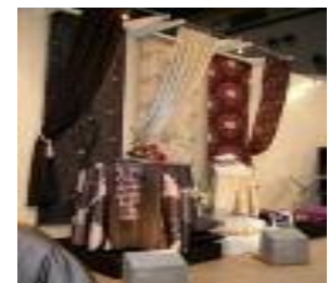
【客室内ファブリック製品】