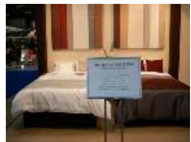
【ポリエステル製デュベカバー】

（注）デュベカバー：羽毛掛けふとん全体をカバーする『ふとんカバー』のことをいい、肌ざわりがなめらかで寝心地が良く、高級感があるため、快適性を重視する高級ホテルからビジネスホテルまで広く普及しつつある。