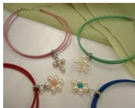
【ペット用防汚パールジュエリーの種類】