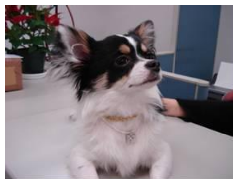
【ペット用防汚パールジュエリー】