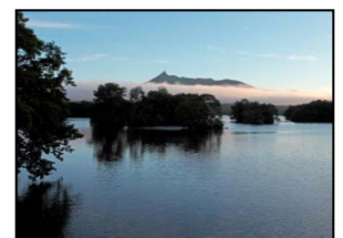
【地域産業資源】 大沼国定公園