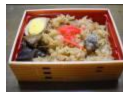
【試作した地鶏めし(製品イメージ)】