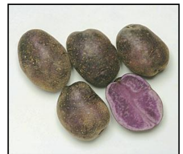
【馬鈴しょ(キタムラサキ)】