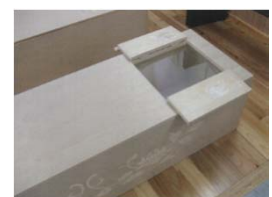
【刺繍を施した棺桶】