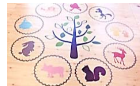
【印刷可能なPETフローリング】