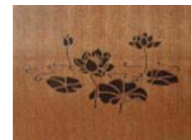
【ペアリング技法による装飾】 (スマートカービング)