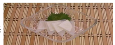
こんにゃくの松前漬け