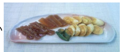
こんにゃくとカブの甘酢漬け