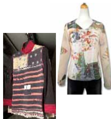
【同社ブランド“yoshi yoshi pj”】