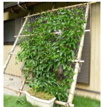
【上写真】緑のカーテン栽培の様子