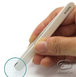
【適度なしなり(ばね)による面キャッチ構造】