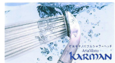
アリアミストカルマン マイクロバブルの効果 【マイクロナノバブルカルマン】