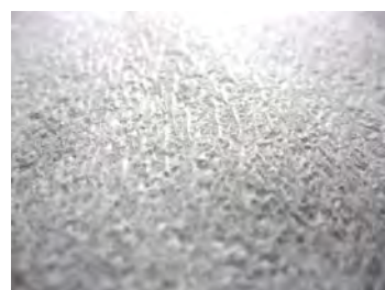
【クレープ加工を施した表面】