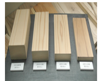
【杉材の圧縮サンプル(左から原板、30%圧縮、50%圧縮、70%圧縮)】