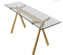
【ICFF2007で高い評価を得る】