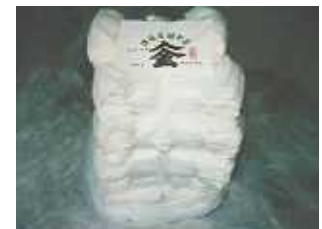
【川俣産繭を利用した入金真綿】

更に、川俣町の絹織物の製造技術と、川俣産の繭を利用した入金真綿入り高級絹掛け布団を製造、顧客満足度の高い商品を中高年層を対象に販路の開拓を図る。