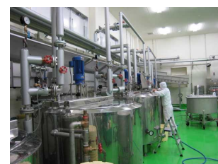
【あま酒の製造ライン(麹室)】