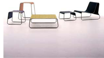
【開発予定商品】 「IGSA series」

・畳や蔦等のい草製品の製造技術を活かし、い草製品が有する美しさや強靭性をはじめ、空気の浄化作用や湿度調整作用等の優位性を維持した畳表や蔦を貼り付けた椅子等の新たな家具商品を開発し、その普及を目指す。