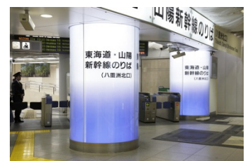
【アクリル製導光板を使用した案内表示】

当商品は加工しやすく、軽く、安価であることから、今後これまで看板(サイン)等に多く使用されていたアクリルに代わり、用途に応じて随時代替されていくことが予想される。