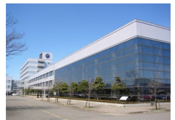
【福井県工業技術センター】