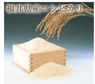
【地域産業資源福井米】

地域産業資源「福井米」の特徴である粘りと食味がそのまま活かせる米粉として活用するため、粉碎方法を工夫しパサつき感のないカステラに仕上げられた。さらに冷凍することにより、懸念される保水性を向上させていくことで、米の風味が活かした米粉カステラで賞味期限が長く設定できる商品化につながられた。「米粉カステラ」というテーマでブランド化していくことで、地域産業資源福井米の認知度が高まり、地域の他の米粉加工業者や稲作農家への波及効果が期待される。