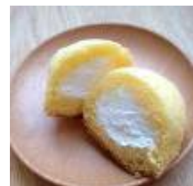
【冷凍状態のクリーム】

冷凍技術のさらなる研究、商品の試作に関しては、福井県食品加工研究所の指導を受け、ブランディング、販路開拓などにおいては、(公財)ふくい産業支援センターの協力を得て、地域の百貨店などでの販売等から事業を進めていく。