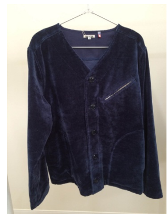
4ピック織り綿×綿の服地を使用したアウター(試作品)