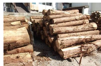
【サンブスギの根木丸太】

公共機関、設計事務所等へは当社が直接提案営業を行い、建設会社・ハウスメーカー・工務店等へは当社販売代理店を通して販売活動を行う。