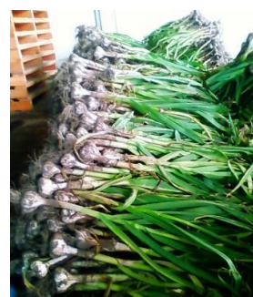
収穫したにんにく