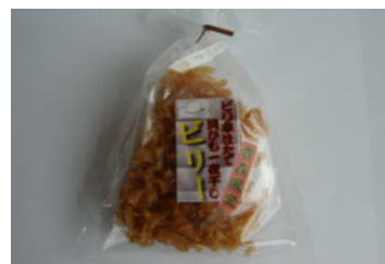
ホタテヒモ一夜干し