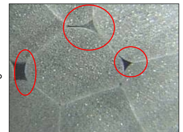
【発泡樹脂の間隙に 薬剤等を含浸させる】