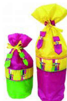
【ギフトパッケージ】